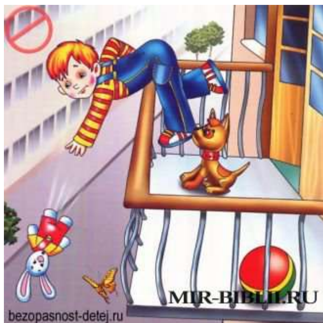
Картинка – не оставляй открытый кран

Из открытого крана вода может быстро заполнить мойку или ванну и потечь на пол. За три минуты из крана выливает столько воды, что можно наполнить ведро. Поэтому не оставляй без присмотра кран, ты можешь про него забыть и всё будет залито водой. Если у вас отключили воду, то обязательно перекрывай кран, иначе когда её включат, потечет вода и всё утонет в ней. И будут плавать башмаки и будут хлюпать сапоги и всё утонет под водой и станет вам она бедой.