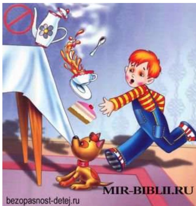
Картинка. Мой руки перед едой

Перед едой всегда мой руки. На руках микробов много, если они попадут в желудок, то ты можешь заболеть. Когда ты хорошо моешь с мылом руки, то вся грязь и микробы смываются с них, и ты можешь безопасно кушать.