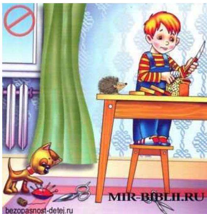
Картинка спички детям не игра

Не играй с острыми предметами – это опасно. Можно уколаться, можно порезаться. Если родители тебе уже разрешают резать ножом еду, то делай это аккуратно, держи руку подальше от лезвия и следи, чтобы оно не соскользнуло и не порезало тебе пальцы.