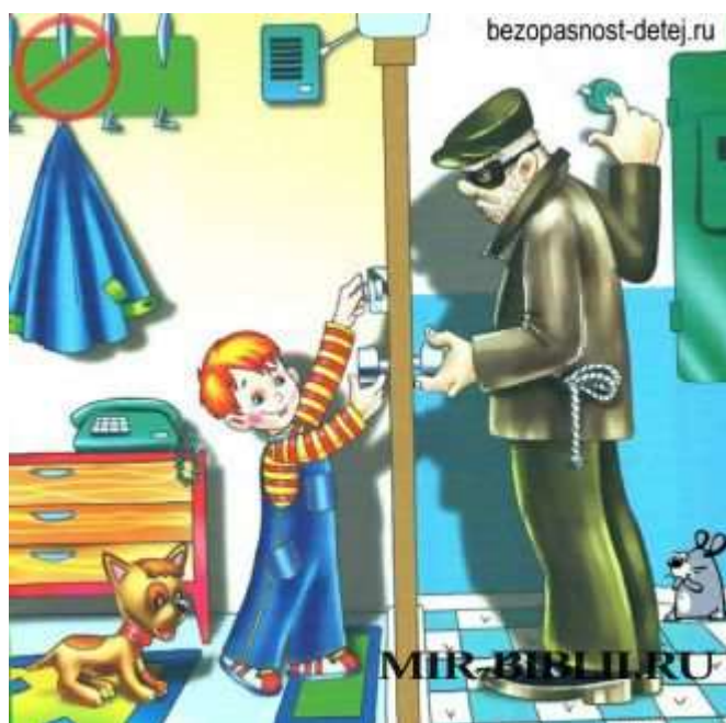
Картинка лекарства никогда сам не ешь

Дверь чужим не открывай, никому вообще. Ни дяде врачу, ни тётке соседке, ни полицейскому, ни сантехнику – это может быть бандит! Даже если за дверью говорят, что это родители попросили – не верь! Сразу позвони родителям скажи, что кто-то пришел и стоит под дверью. Если кто-то чужой пытается открыть дверь твоей квартиры, сразу звони в полицию и называй свой адрес или через окно зови на помощь прохожих.