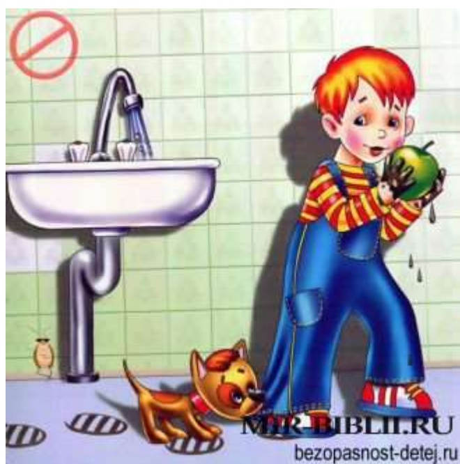
Картинка. Не говори по телефону с незнакомцами

Перед едой всегда мой руки. На руках микробов много, если они попадут в желудок, то ты можешь заболеть. Когда ты хорошо моешь с мылом руки, то вся грязь и микробы смываются с них, и ты можешь безопасно кушать.