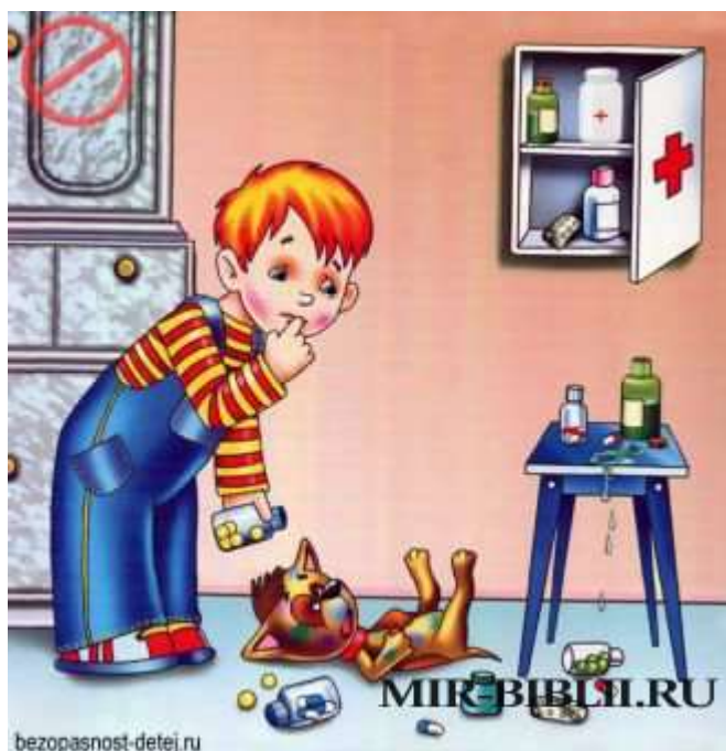
Картинка острые предметы опасны

Не играй с острыми предметами – это опасно. Можно уколаться, можно порезаться. Если родители тебе уже разрешают резать ножом еду, то делай это аккуратно, держи руку подальше от лезвия и следи, чтобы оно не соскользнуло и не порезало тебе пальцы.